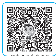
配套名师高清视频