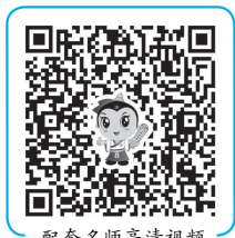
配套名师高清视频

6. 治疗: ①病原菌不明首选 三代头孢 ; ②肺炎球菌、脑膜炎双球菌首选 青霉素 ; ③大肠杆菌首选 三代头孢 ; ④有脑水肿尽早使用 糖皮质激素 。